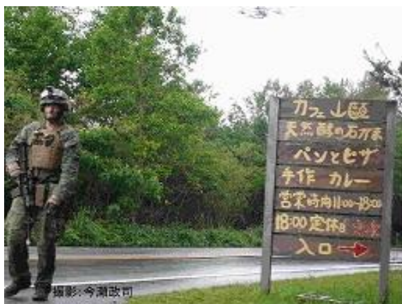
【写真】銃を持って公道を歩くアメリカ軍の兵士とカフェの看板

一般の公道(県道)では、武装した米軍の兵士たちが隊列を組んで道端を行進していることもある。筆者が現地調査に訪れた際には、人里近くの片側一車線の道路の左右(県道の歩道)で、武装した米軍の兵士たち20人位が隊列を組んで道端を行進していた。戦闘用の迷彩服を着てリュックを背負って、手には大きな「銃」を持っていた。ジャングルで戦闘訓練をした後と見られた。米軍の兵士たちは銃を持って平然と歩いているが、そこは民間地で一般の公道(県道)であるから、無論、法律違反である。