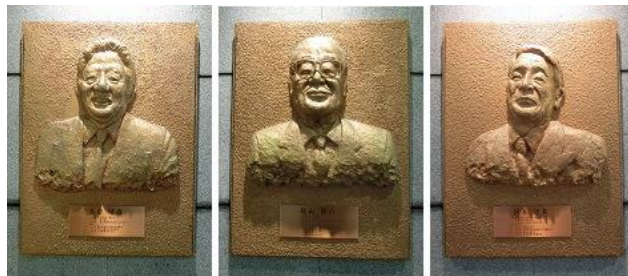
【写真】「沖縄米軍基地所在市町村活性化特別事業」の功労を称える肖像レリーフ(左から、島田晴雄慶応大学教授、梶山静六官房長官、岡本行夫首相補佐官(肩書きは当時))

嘉手納ロータリーには、町内でひときわ大きく2棟の再開発ビルがそびえ建つ。町の公共施設が入る「ロータリープラザ」(公民館、図書館、温水プール、子育て支援センター等)、那覇市から移転した沖縄防衛局、入国管理局が入居するロータリー1号館である。ロータリープラザの1階玄関ロビーには、島田懇談会事業の功労を称え、後世に伝える趣旨で、赤銅色に輝く3体の肖像レリーフが設置されている。それぞれのプレート内に、功労者として梶山静六、岡本行夫、島田晴雄の3人の上半身をかたどった彫像が収まっている。