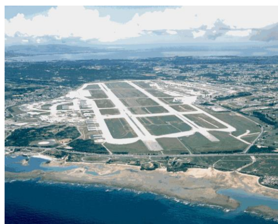
【写真】アメリカ軍「嘉手納飛行場」

第二次世界大戦の前、沖縄本島中部という地理的条件に恵まれた嘉手納町(旧北谷村嘉手納)は、沖縄県営鉄道の嘉手納線(廃線)も運行する物流の拠点であった。だが、戦時中に旧日本陸軍「中飛行場」が建設されたこともあって、米軍の本島最初の上陸地点となり、し烈を極める集中砲火を浴び、まちはすべて破壊され焦土と化した。戦後、米軍が飛行場を拡張し、管理強化していき、